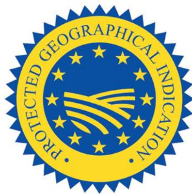
Indicazione Geografica Protetta