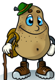
Patata della Bisalta