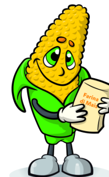
Farina di mais