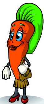
Carota di San Rocco