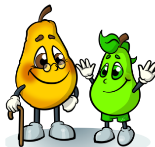
Pera bio e pera Madernassa