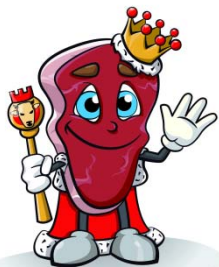
Carne bovina di razza piemontese