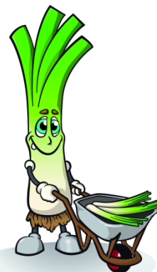
Porro di Cervere