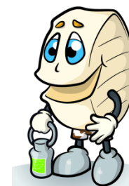
Tomino fresco bio