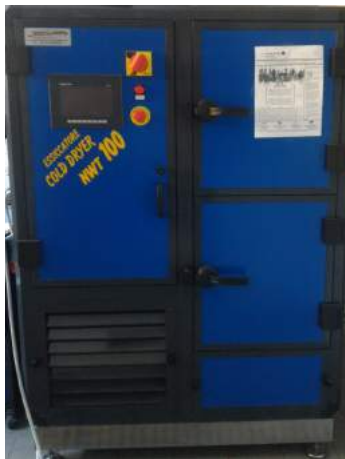
Essicatore a freddo 100kg con impianti frigoriferi che disidratano l'aria

UN LABORATORIO A DISPOSIZIONE DELLE AZIENDE...e non solo