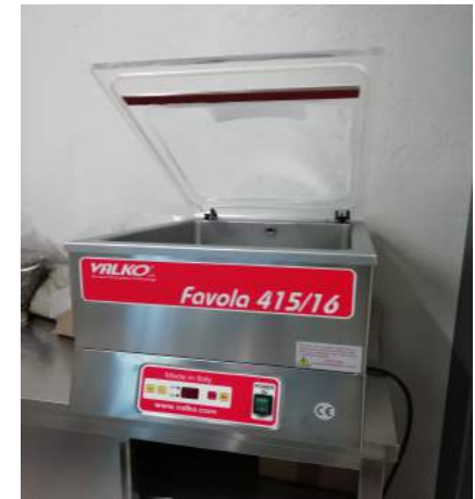
Confezionatrice a Campana potenza 700W pompa 16m 3 /h