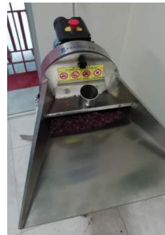
Mulino trancia erbe e polverizzatore mod. TP2